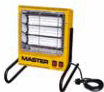
TS 3A ONDE CORTE