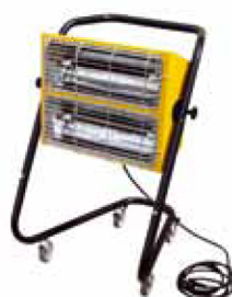
HALL 3000 ONDE LUNGHE